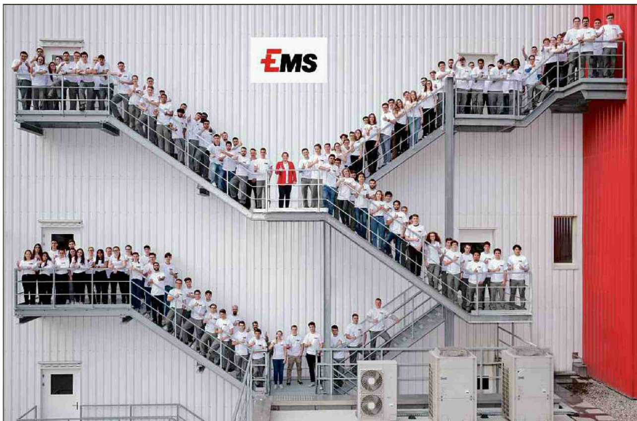
Emprendistas ed emprendists da l'Ems Chemie.