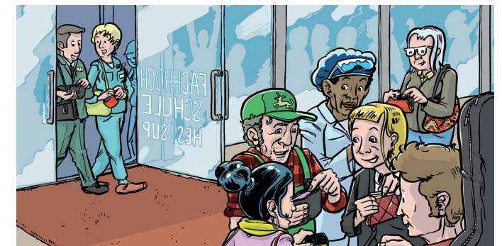
Illustration: Marian Blaser

Contribution de 10 000 CHF à l'association faitière FH SUISSE, Zurich