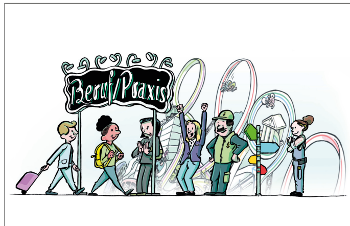
Die Förderung des Nachwuchses soll mit der Übersetzung der Website steigeinsteigauf.ch ausgeweitet werden.

Die interaktive Webseite www.steigeinsteigauf.ch von FH SCHWEIZ zeigt den Jugendlichen, den Eltern und den Lehrpersonen, welche Möglichkeiten nach der Berufslehre offenstehen. Ob der direkte Einstieg in die Arbeitswelt, ein Studium an einer Fachhochschule, einer Höheren Fachschule oder der universitären Hochschule – jeder kann selber wählen, was zu ihm passt. Der Einstieg und Aufstieg steht allen offen. Die Visualisierung erhielt mit der FH-SCHWEIZ-Kampagne «Unser Nachwuchs» eine weitere Dimension. FH-Botschafterinnen und -Botschafter, die selbst eine Berufslehre sowie ein Fachhochschulstudium gemacht haben und heute Führungspersonen sind, zeigen in Videos und Podcasts auf, weshalb die Berufslehre ideale Voraussetzungen für eine Karriere bietet. Die Website hat massiv an Besucherinnen und Besuchern gewonnen.